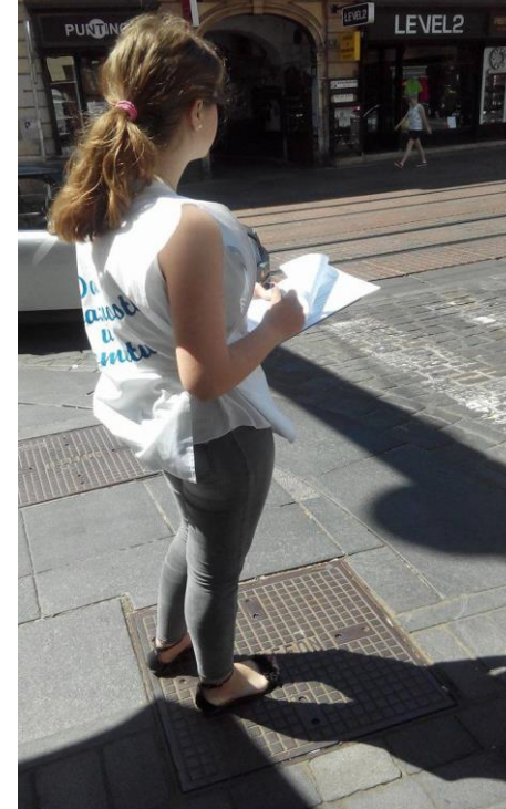
Slika 1. Akcija nam je omogućila uvid u situaciju koja vlada na našim prometnicama.