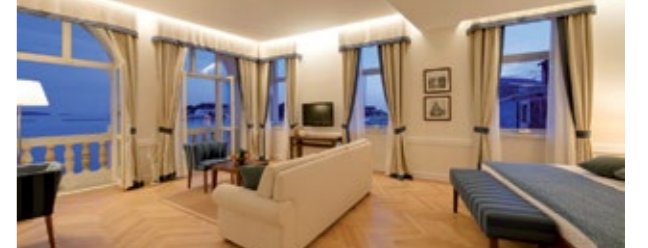
Valamar Villa Parentino****