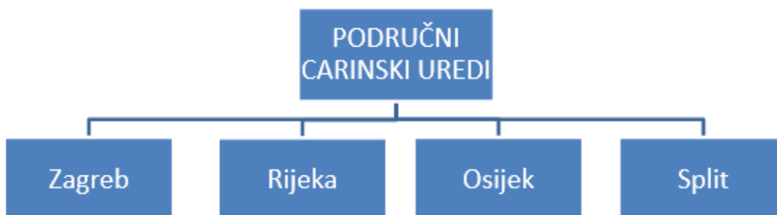
Slika 2. Shematski prikaz Područnih carinskih ureda